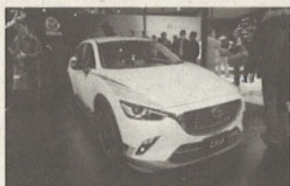
▲2月末に発売予定のCX-3をベースにした「CX-3 Racing コンセプト2015」も出品。見た目にもスポーティで走って楽しそうなことをうまくアピールしていた