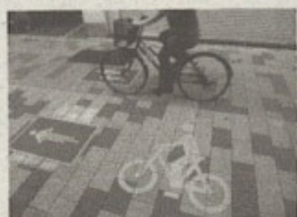
▲歩道が広い場合には、自転車走行帯が設けられているところもある。しかし、写真の自転車ユーザーはそこを走らず、歩道を走ってしまった。自転車のユーザーのマナーが問われる！

ないなと思うし、クルマに乗ると自転車の傍若無人ぶりに閉口する。両者相容れない関係性だ。交通事故全体に占める自転車関与率は、全国で20%前後、都内では35%。自転車事故は事故扱いにならないケースもあるだろうから、実態はもっと多いだろう。圧倒的に都内は自転車事故率が高いのだ。