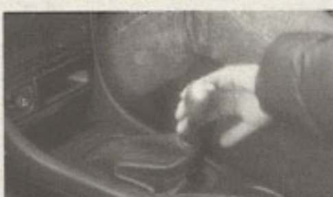
▲2013年のオートマチック限定免許の取得者割合は55%で、最近ではMT車に運転できる人の方が少なくなりました。しかし、だからこそMT車をうまく乗りこなせると、それだけでカッコ良かったりするのだ!

たステッカー一枚だけかもしれないが、その違いは絶大だ。彼らの言い分を聞いてみると、クルマを所有すると維持費がかかるし壊れたら金もかかる。東京近郊なら公共交通機関で足りるし、家の親父のクルマを借りればそんなに困らない。バランスを考えると「いやなかな〜」などと考えるし「まっとうだ」。 確かに短期的には賢い判断かもしれないが、やっぱり長期的視野でみるとどうかと思うのだ。「クルマがいるかいらないか」ではなく、「好きなものを手に入りたい!」と思うことで、未来