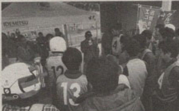
▲本誌とのコラボでも行われているドライビングレッスンなども、今後は若い人たちに興味を持ってもらえるようなイベントを盛り込んでいきたいとのこと

●みんな、考えてくれ とりあえずウェブサイトに關しては、キラリコンテンツを考えたい。何か良いアイデアはあるかな。 たとえば雑誌と連動して、自動車評論家と同じ車に乗せて記事も書かせてみて、どちらが面白い投票を募る。あるいはトヨタ賞とか日産賞とかを設けて最優秀インプレッションを表彰する。さらに投票してくれた年齢層とか性別などを分析して、どういう人がどういう傾向にあるかをリサーチする。それを元に、さらに魅力的なコンテンツを再構築する。なんてのはどうだろう。 あるいはクルマ離れを食い止めるためにはどうすればいいか、という直球のテーマを設けて論文を募集、それに対して懸賞を出す。 オレが考え付いたアイデアはこんな程度だが、読者の中でも良いアイデアがあったらぜひ提案してほしい。 そうだなあ、やっぱりあとは学生に考えさせよう。人を育てる。若者をその気にさせる。それもネクスト・カー・ジェネレーションのテーマだろう。